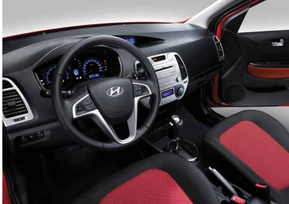
Tabla sa instrumentima

Elektronika se koristi da spreči da Vaše kočnice blokiraju usled naglog kočenja (ABS) i da pomogne pri kontroli vozila uz pomoć ESP-a kada površina puta po kojoj vozite iznenada postane krivudava ili klizava. Sve se to dešava automatski, tako da sam vozač i nije svestan da ovi sistemi deluju.